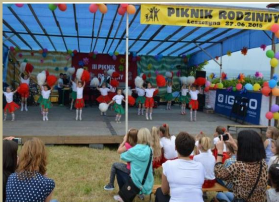
Piknik Rodzinny w Gminie Trzciana