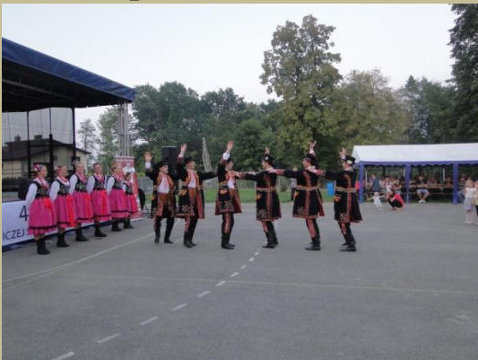
Pożegnanie lata w Gminie Rzeszawa