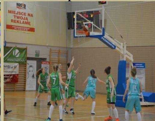
Międzynarodowy Festiwal Koszykówki w Bochni