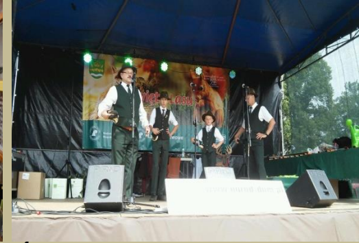
Święto Lasu w Gminie Drwinia