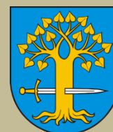
Gmina Lipnica Murowana