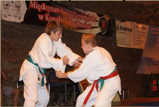
Międzynarodowy Turniej Judo w Kopalni Soli w Bochni