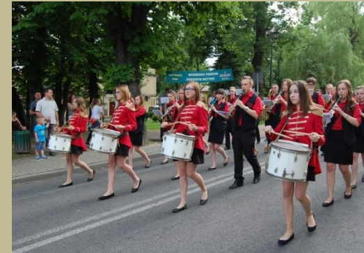
Parada Orkiestr Dętych w Nowym Wiśniczu