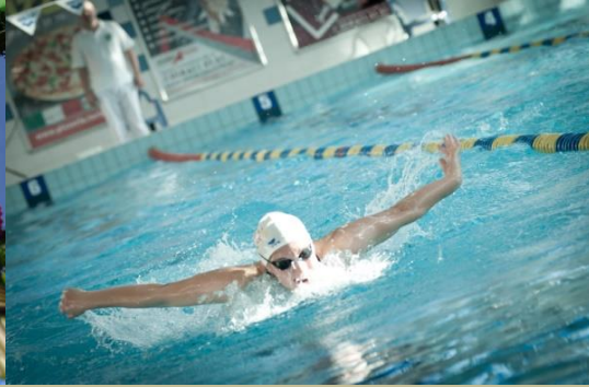
Memoriał Pływacki im. Jana Kota w Bochni