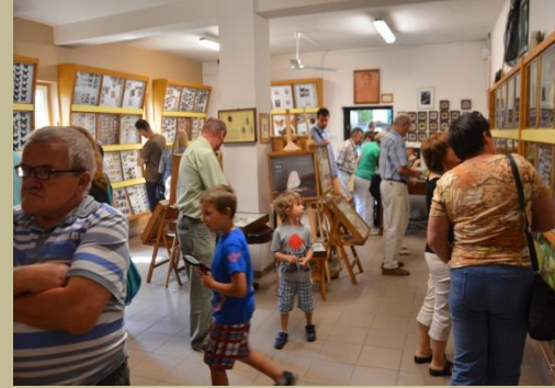
Weekend z zabytkami Powiatu Bocheńskiego