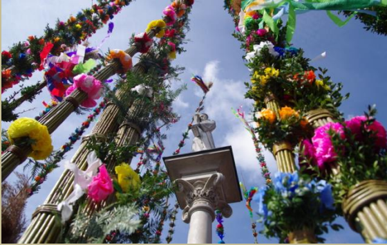
Konkurs Lipnickich Palm i Rękodzieła Artystycznego w Lipnicy Murowanej