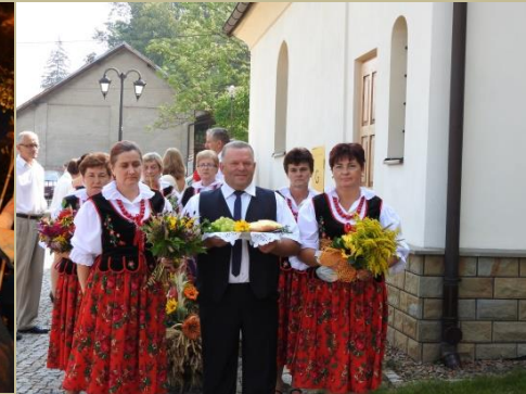
Dożynki Parafialne w Gminie Łapanów