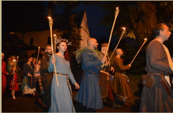
Spotkanie z Historią w Gminie Bochnia